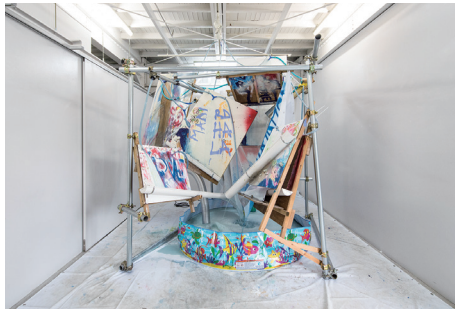
10~24 water molecules Dan Isomura 2017