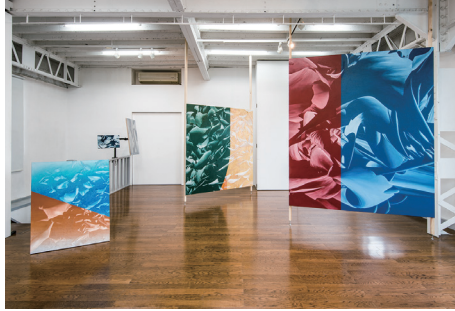
~ Ryunosuke Goji 2018